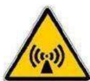
Radiazioni non ionizzanti