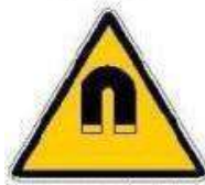
Campo magnetico intenso