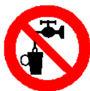
Acqua non potabile