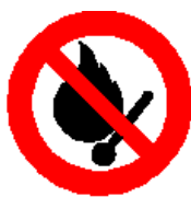
Vietato fumare o usare fiamme libere