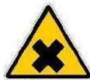
Sostanze nocive o irritanti