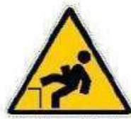
Caduta con dislivello