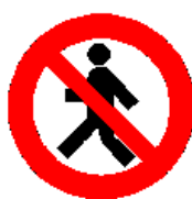
Vietato ai pedoni