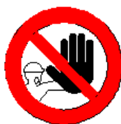
Divieto di accesso alle persone non autorizzate