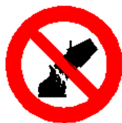
Divieto di spegnere con acqua