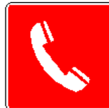
Telefono per interventi antincendio