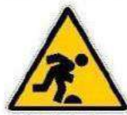
Pericolo di inciampo