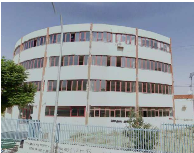
SEDE BOCCIONI (IPSC-IPA)